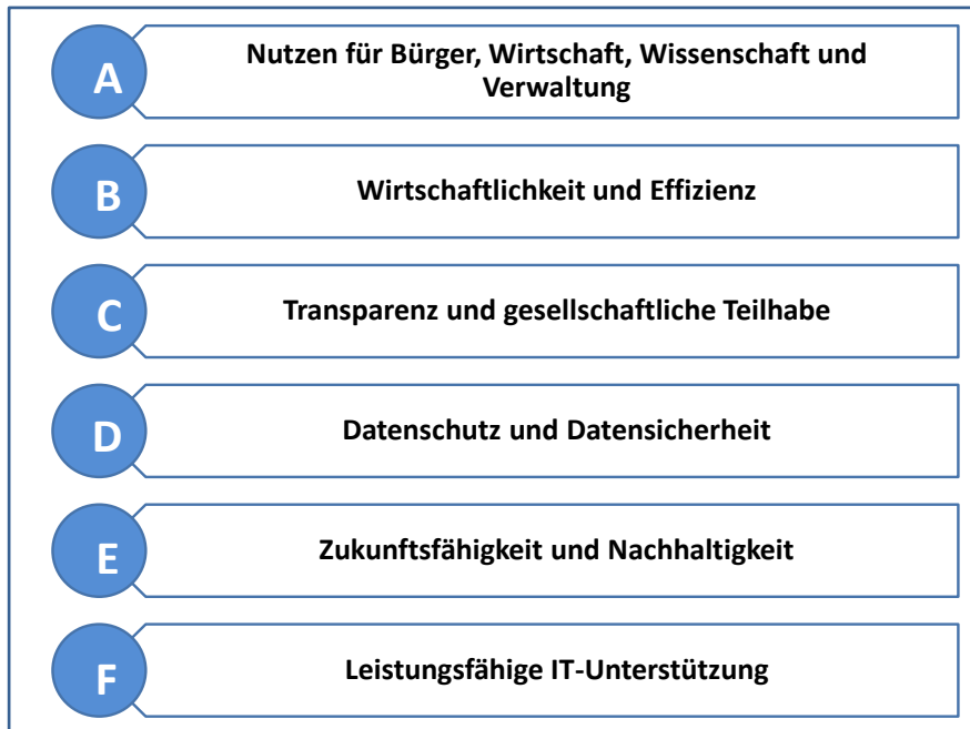
Abbildung 2: Zielsystem der NGIS

Die NGIS orientiert sich an der nationalen E-Government-Strategie und stellt einen angestrebten Zustand dar.